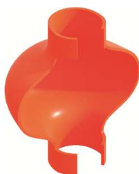
Protezione nodo in tubo e giunto (Rif. N. 4007.003)