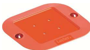
Sottobasetta (Rif. N. 4007.004)