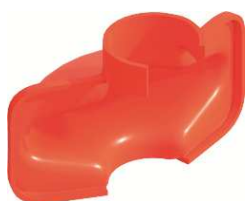
Protezione rosetta Allround, con corrente (Rif. N. 4007.001)