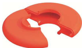
Protezione rosetta Allround, senza corrente (Rif. N. 4007.002)